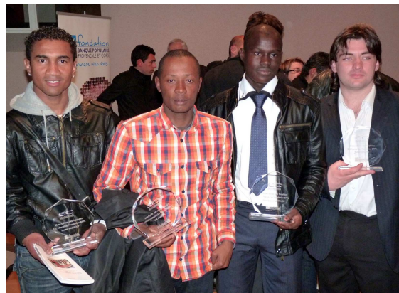
Les 5 stagiaires qui ont été mis à l'honneur