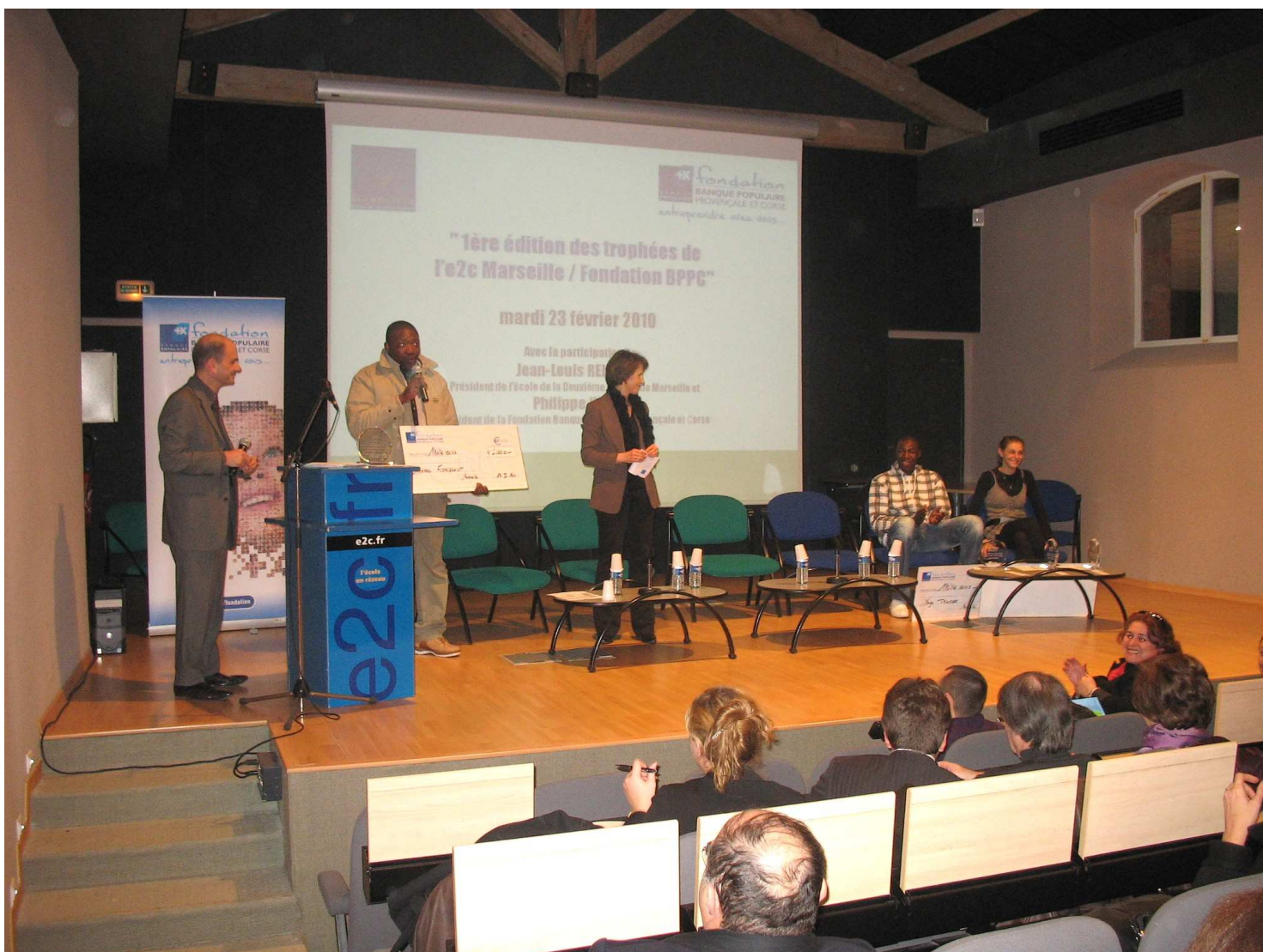
« 1 ère édition des Trophées 2009 E2C Marseille / Fondation BPPC »